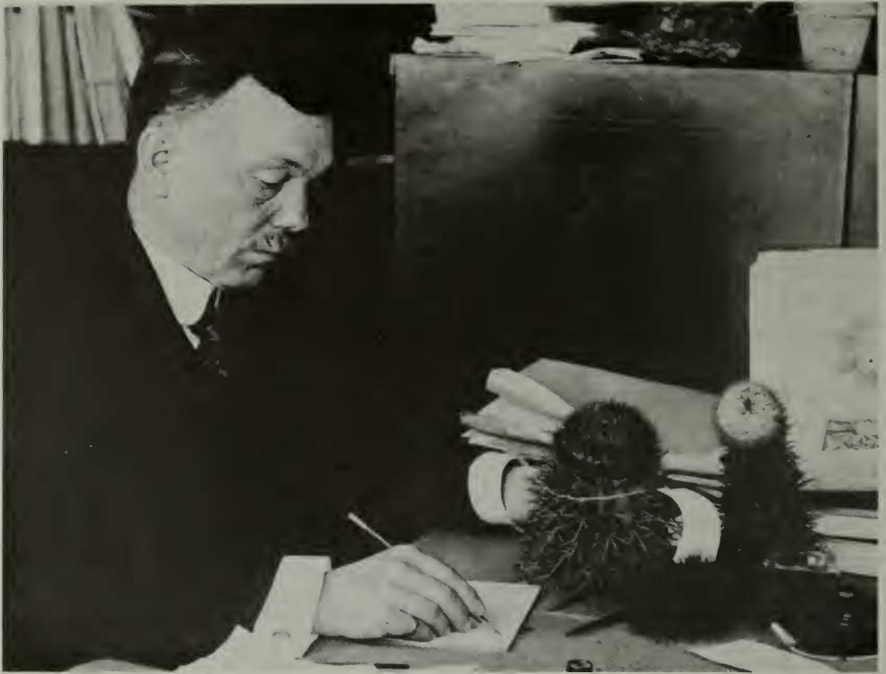
Fig. 2. El botánico Joseph N. Rose.

de plantas. Varias plantas fueron recolectadas cerca de los puertos de Cristóbal, Panamá, y de Port-au-Prince, Haití.